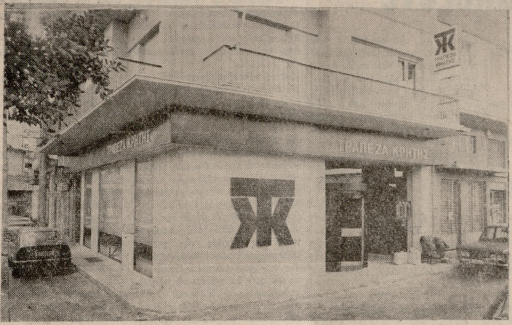
Το Υποκατάστημα της Τραπέζης Κρήτης στο Ηράκλειο επί της Πλατείας Καλλιεργών του οποίου τα εγκαίνια θα γίνουν σήμερα το μεσημέρι.