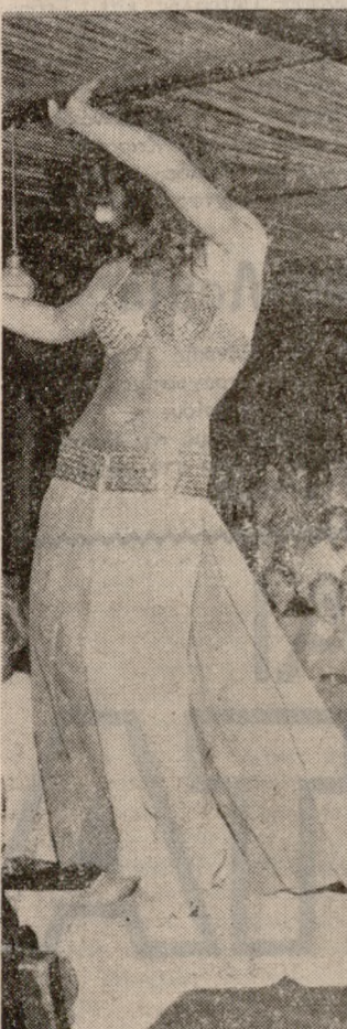
ΜΕ ΠΟΛΥ ΚΕΦΙ

ΞΕΝΟΔΟΧΕΙΟ ΣΕΙΡΗΝΕΣ ΜΑΛΙΑ ΕΝΑ ΝΑΪΤ ΚΛΑΜΠ ΜΕ ΤΙΜΕΣ ΠΡΟΣΙΤΕΣ ΓΙΑ ΟΛΟΥΣ