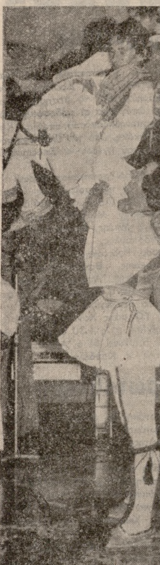
ΜΕ ΠΟΛΥ ΘΕΑΜΑ