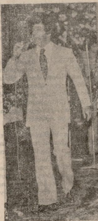
ΜΕ ΠΟΛΥ ΜΟΝΤΕΡΝΟ ΧΟΡΟ

ΞΕΝΟΔΟΧΕΙΟΝ ΣΕΙΡΗΝΕΣ (ΜΑΛΙΑ) ΣΤΟ ΠΙΟ ΟΜΟΡΦΟ ΝΑΪΤ ΚΛΑΜΠ ΤΗΣ ΚΡΗΤΗΣ ΠΑΡΟΥΣΙΑΖΟΥΜΕ ΤΟ ΠΙΟ ΠΡΩΤΟΤΥΠΟ ΠΡΟΓΡΑΜΜΑ