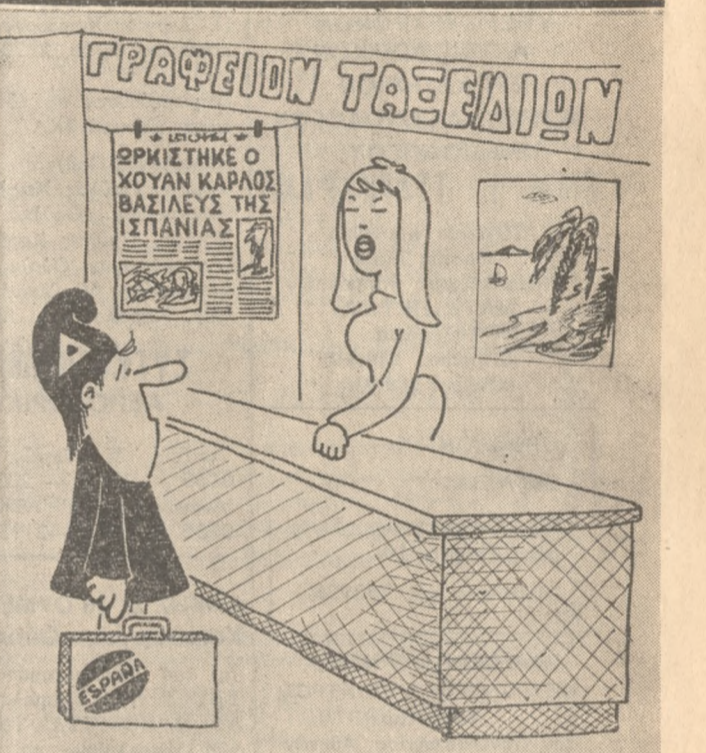
Είπατε πός θέλετε ν' ακούσετε τò εισιτήριό σας για τήν Ισπανία; Αν επιτρέπετε για

Ο Γενικός Πρόεδρος τής Έλλάδος κ. Κούφης, ο Γενικός Πρόεδρος τής Γαλλίας κ. Μπαρτρεμιέρ, ο Γενικός Πρόεδρος τής Γερμανίας κ. Σπένγκελ, ο Γενικός Πρόεδρος τής Ισπανίας κ. Κοντομιλί, ο Γενικός Πρόεδρος τής Πορτογαλίας κ. Μπαρζοζ, ο Γενικός Πρόεδρος τής Ολλανδίας κ. Βαν Βέρφ, ο Γενικός Πρόεδρος τής Αμερικής κ. Φόρντ, ο Γενικός Πρόεδρος τής Κίνας κ. Ζενγκ, ο Γενικός Πρόεδρος τής Βρετανίας κ. Σάουτντ, ο Γενικός Πρόεδρος τής Ιαπωνίας κ. Νιχίρα, ο Γενικός Πρόεδρος τής Σοβιετικής Ένωσης κ. Κοσιγιόφ, ο Γενικός Πρόεδρος τής Αυστραλίας κ. Φριντλάντ, ο Γενικός Πρόεδρος τής Νέας Ζηλαντίας κ. Μάκνταϊν, ο Γενικός Πρόεδρος τής Αργεντινής κ. Βιγιέρ, ο Γενικός Πρόεδρος τής Βραζιλίας κ. Νεβίζ, ο Γενικός Πρόεδρος τής Ουρουγουάης κ. Μπαρσινέλι, ο Γενικός Πρόεδρος τής Παραγουάης κ. Λαφραγιό, ο Γενικός Πρόεδρος τής Χιλή κ. Αλντορίν, ο Γενικός Πρόεδρος τής Κολομβίας κ. Λόπες Μενεζές, ο Γενικός Πρόεδρος τής Κόστας Ρίκας κ. Ούρεφ, ο Γενικός Πρόεδρος τής Παναμάς κ. Αρβανί.