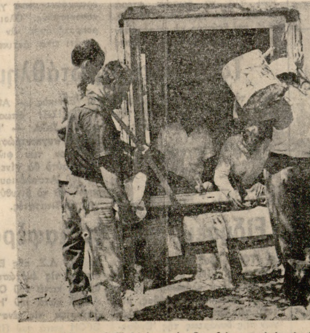
Μέλη του Συλλόγου έπιδορθώνουν οικία άπόρου οικογενείας.