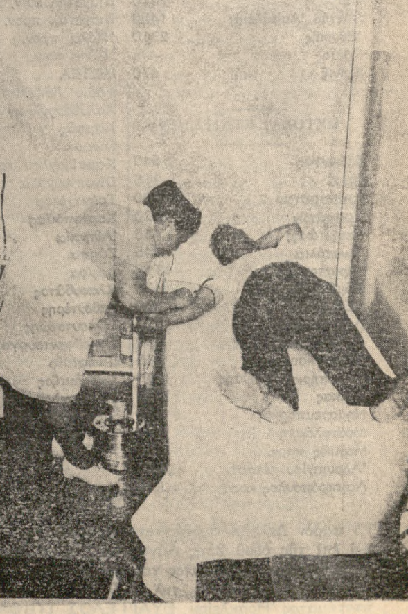
Προσφορά αίματος από αίμοδότη — μέλος του Συλλόγου