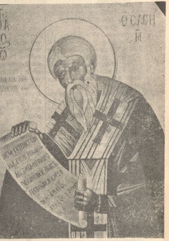
Ο ΑΓΙΟΣ ΙΩΑΝΝΗΣ Ο ΕΛΕΗΜΩΝ

Περαίνοντας την άναφορά μας για την δραστηριότητα του Συλλόγου «Άγιος Ιωάννης ο Έλεημων» προσκαλούμε όσους έπιθυμούν να άσκήσουν έργο φιλανθρωπίας είτε με υλική συνδρομή είτε με ήθικη συμπράξαση είτε και με προσφορά στο Τμήμα αίμοδοσίας να έγγραφούν μέλη - φίλοι, με την πεποίθησι ότι σε όλες τις περιπτώσεις συμβάλουν στην άνακούφιση του πόνου, στην καταπολέμηση της ένδειας και στη έργα άγάπης την όποιον έδιδασε ο Χριστός, την έπιφάνεια του όποιου η άνθρώπινη θά έορτάσει σε λίγες μέρες.