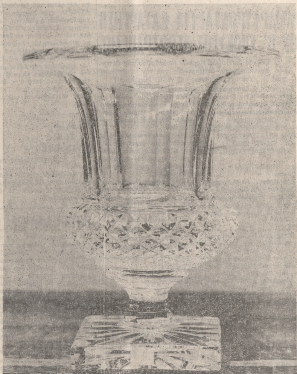
Τὸ κατάστημα «ΝΓΕΚΟΡ» Δαιδάλου 16 τηλ. 287.673 σὰς εὐχεται ΧΡΟΝΙΑ ΠΟΛΛΑ

ΣΑΣ ΕΥΧΟΜΕΘΑ ΧΡΟΝΙΑ ΠΟΛΛΑ DAS-HELLAS ΑΣΦΑΛΕΙΑΙ ΝΟΜΙΚΗΣ ΠΡΟΣΤΑΣΙΑΣ ΥΠΟΚΑΤΑΣΤΗΜΑ ΚΡΗΤΗΣ 25ης ΑΥΓΟΥΣΤΟΥ 42 ΗΡΑΚΛΕΙΟΝ ΤΗΛ. 281-640