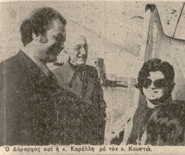
'Ο Δήμαρχος και η κ. Καρέλλη με τον κ. Κουστώ.

ΠΡΟΧΘΕΣ το πρωί κατέπλευσε στο λιμάνι μας το γνωστό σκάφος «Καλιψών», επί του οποίου έξερευνήθησαν τόν βυθόν κ. Ζάκ Κουστώ και οι επιστημονικοί του προσωπικοί, καθώς επίσης και ο Έλληνας αρχαιολόγος κ. Κριτζής. Ο κ. ΚΟΥΣΤΩ πραγματοποίησε από 4μηνου έξερευνήσεις στις χθές άρχισαν έρευνες στην θαλάσσια περιοχή περί τής Ντίας γίναντε άρχαιότητες και πολλά άγκυροβολεία.