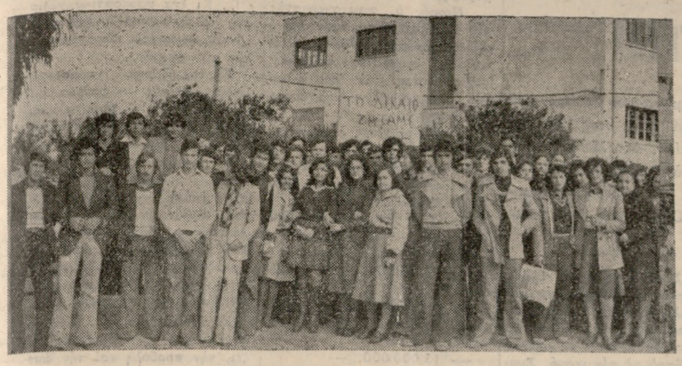
Οι μαθητές και οι μαθήτριες των τριών τελευταίων τάξεων του Οικονομικού Γυμνασίου 'Ηρακλείου, σε χθεσινή φωτογραφία έξω από το Σχολείο τους.