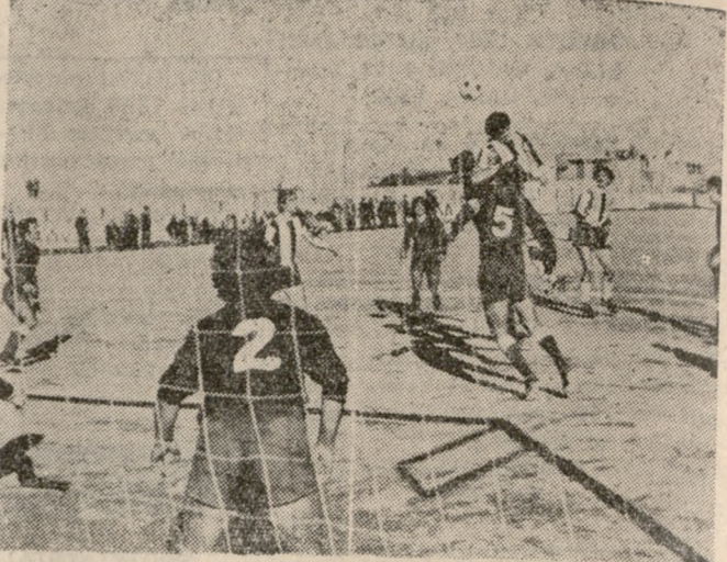
ΣΥΝΑΓΕΡΜΟΣ ΣΤΗΝ ΕΣΤΙΑ ΤΟΥ ΟΡΦΕΑ ΜΕΤΑ ΑΠΟ ΚΟΡΝΕΡ ΠΟΥ ΕΧΕΙ ΚΤΥΠΗΣΕΙ Ο ΜΗ ΔΙΑΚΡΙΝΟΜΕΝΟΣ ΕΣΜΕΡΙΤΑΚΗΣ