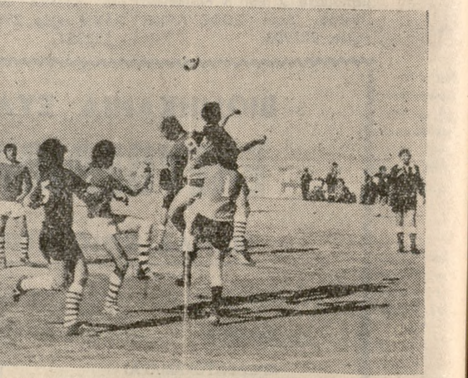
ΜΙΑ ΦΑΣΗ ΑΠΟ ΤΟΝ ΣΥΝΑΓΕΡΜΑΤΙΚΟ ΓΑΜΝΟ ΠΟΑ - ΗΡΟΔΟΤΟΥ (1-1)

ΙΣΟΠΑΛΟ (1-1) Έλθε το ντέρμπι του τοπικού πρωταθλήματος ΠΟΑ - Ήροδοτος, που διεξήχθη το πρωί της Κυριακής στο γήπεδο του πρώτου.