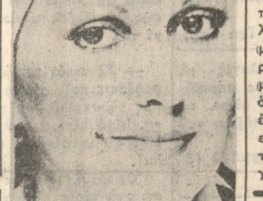
PERSONAL SKINCARE SYSTEM. Η σοβαρή επένδυση στην πολυτιμή ομορφιά σας.