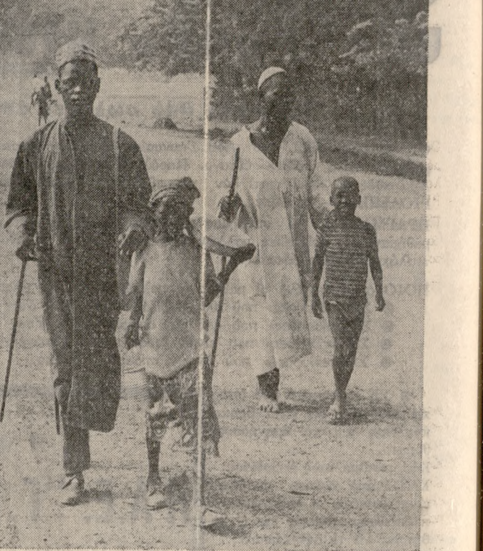
Παιδιά ὁδηγοῦν τυφλοὺς μέσα ἀπὸ τὴν Οὐάγκανταούγκου

Ἡ ἐνέργεια αὐτὴ ὑποστηρίζεται συγχρόνως ἀπὸ πολλὰ κράτη, μετὰ τῶν αὐτῶν καὶ ἀπὸ τὴν Δυτικὴν Γερμανία, ἀπὸ ὁμοῦ τῆς Διεθνοῦς Τραπεζῆς καὶ ἀπὸ τὸν Ὀργανισμό Ἰντερμὲν Ἐθνῶν — κερφάλια ἀνεπτύξεως. Στὴς περιοχὲς πού ἐπικρατεῖ τὴν ἐμάρση μὲ γὰρ πρῆπει νὰ μπορῶσιν νὰ ἐγκατασταθοῦν ἐκ νέου οἱ ἄνθρωποι καὶ νὰ ὁμοιωθοῦσιν οἰκισμοί. Τὸ πρόγραμμα προβλεπτεῖ τὴν ὑποστήριξη τῆς μετοικίας τὸν ἀνθρώπων αὐτῶν νάρχισιν πάλι νὰ εὐδοκίμῃ: ἡ γεωργία καὶ ἡ ὁμολὴ καὶ κοινὴ ζωὴ.