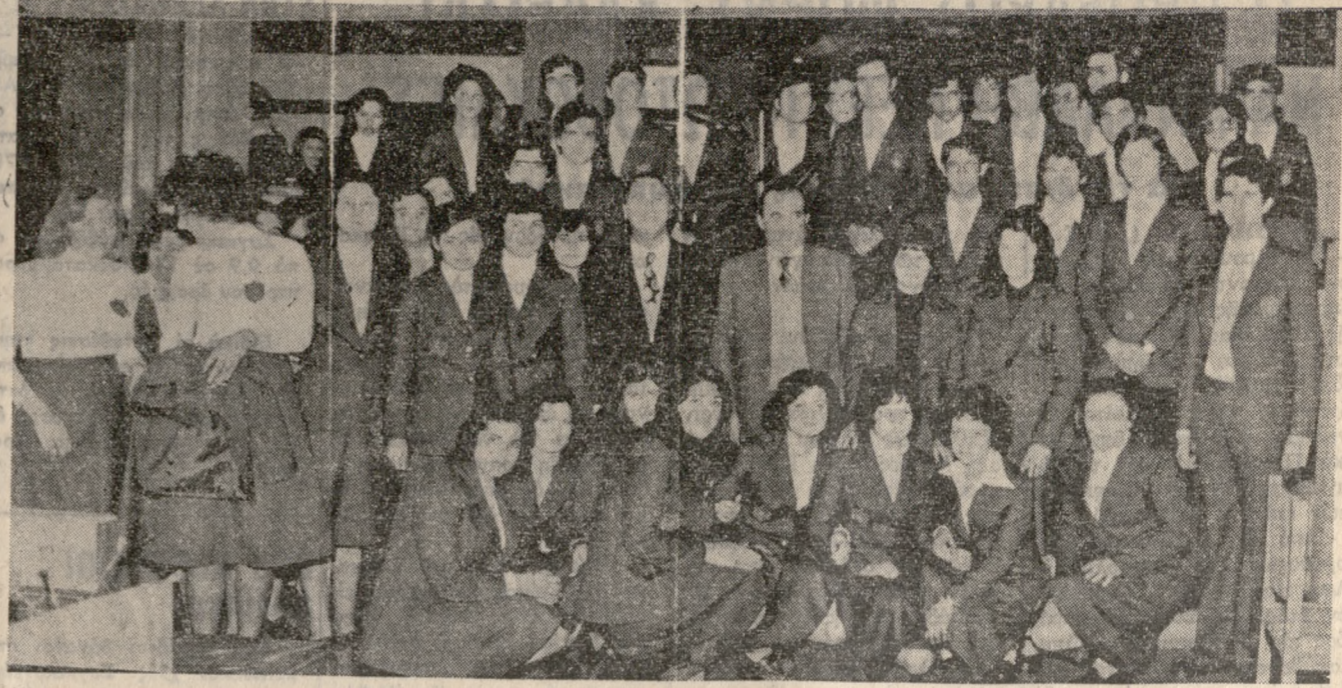
Ο Νομάρχης Ηρακλείου κ. Μπίσιας έκοψε προχθές τήν πίττα τής Σχολής Τουριστικών Έπαγγελματιών Ηρακλείου, στο ξενοδοχείο «Κάντια Μπίτης». Στη συνέχεια φωτογραφήθηκε μέ τό διδακτικό προσωπικό και τούς μαθητές και μαθήτριες που παρακολούθουν αυτήν τήν έποχή τά μαθήματα τής Σχολής.