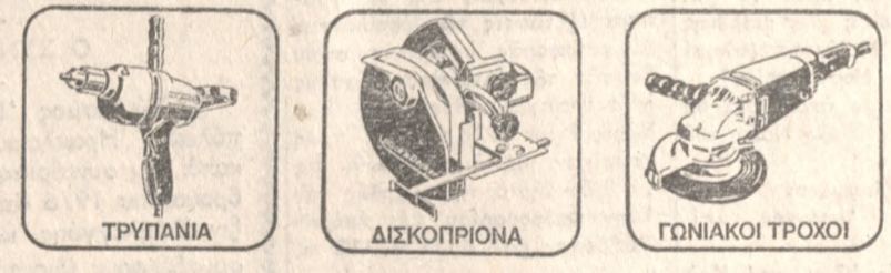
ΤΡΥΠΑΝΙΑ ΔΙΣΚΟΠΡΙΟΝΑ ΓΩΝΙΑΚΟΙ ΤΡΟΧΟΙ

ΗΛΕΚΤΡΙΚΑ ΕΡΓΑΛΕΙΑ ΓΙΑ ΚΑΘΕ ΕΠΑΓΓΕΛΜΑΤΙΑ ΚΑΙ ΕΡΑΣΙΤΕΧΝΗ