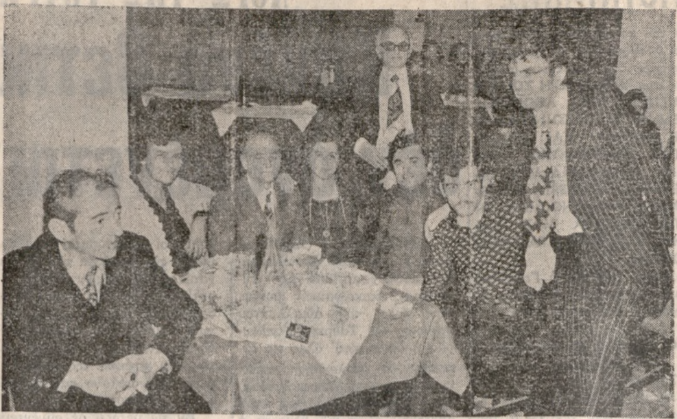
Πρωτοπόρα ή Α.Ε. Κυλινδρόμυλοι Κρήτης Χανίων έκοψε τ'ό Σάββατο έβδου τήν πίττα της στο «ΑΛΚΥΩΝ» με καλεσμένους τούς 'Αρτοποιούς και 'Εμπόρους άλεύρου τών Νομών 'Ηρακλείου και Λασιθίου.