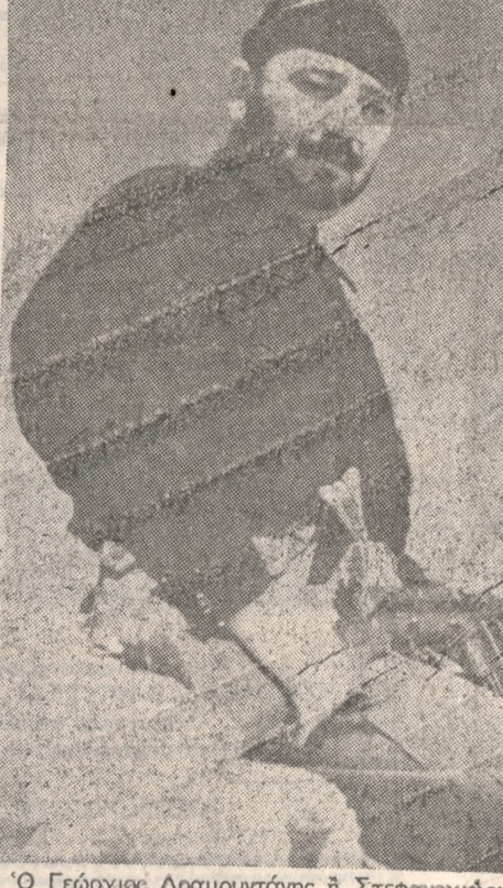
Ο Γεώργιος Δραμουντάνης ή Στεφανογιώργης κατά την έπική εποχή της 'Εθνικής 'Αντίστασης.

άνυπαρξιν και έκρημνίζεις την ζώντα κατά την στιγμήν τού θανάτου. Διά τήν χριστιανισμόν ή ζήη περιήρανε από τόν θάνατον συνεχίζεται.