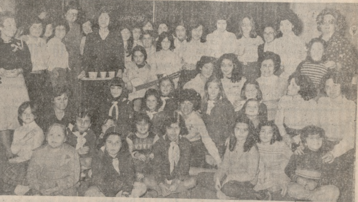
Δύο φωτογραφίες ἀπὸ τὴν ἐορτὴν τῶν ὀδηγῶν.