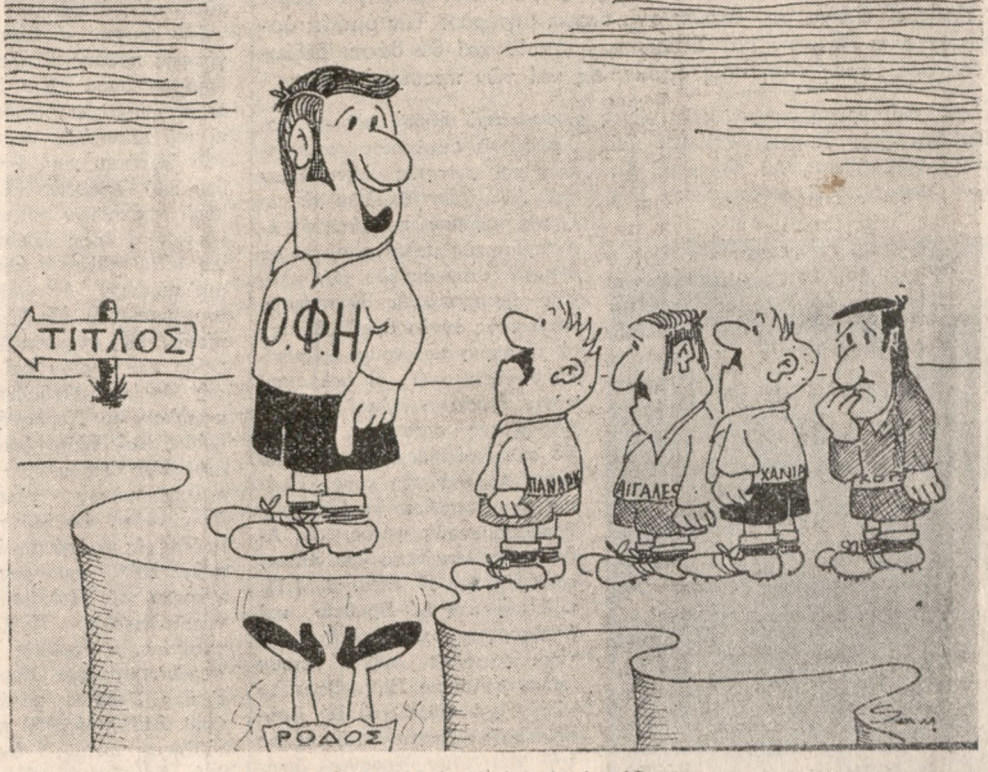
Ίδου ή Ρόδος, ιδού και το πηδάλιο... (Τού ΒΑΓΓΕΛΗ ΣΑΜΑΡΑΚΗ)