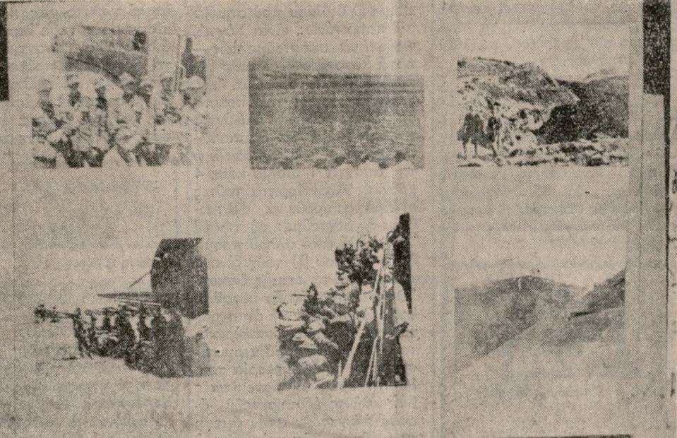
ΑΡΧΙΣΕ ΧΘΕΣ ΣΕ ΟΛΟ ΤΟ ΝΗΣΙ