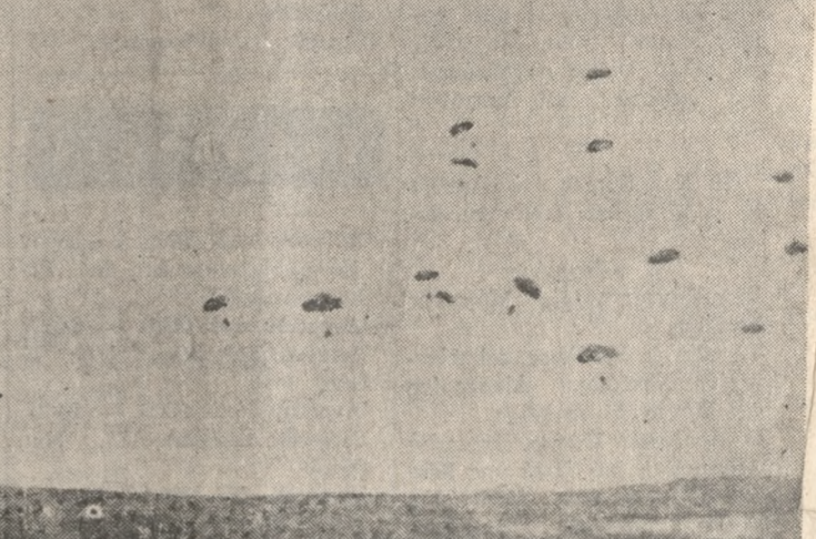
Ξαφνικά, ο ουρανός γέμισε άνοιχτές όμπρες, που έπέφταν, αυτές, βροχή θανάτου και βίας, πάνω στην άλυποφαστη άνοιξη της Κοητικής γής. Όμπρες, προστασίας από τέτοια θεομηνία δεν είχαν οι Κοητικοί. Είχαν, όμως, την ψυχή τους και μερικά άκουριασμένα παλιόσιδερα που ούτε ή δικτατορία του Μεταξά δεν τάχε λογαριάσει για σπλάγια να τά πάρει. Μ' αυτά και την ψυχή τους λοιπόν, άντιμετώπισαν τη θεομηνία του πολέμου τον πιο οργανωμένο στρατό του κόσμου. Ήρθαν τά εστούκα και γέμισαν ο ουρανός βρυχθμούς κι ό τόπος πληγές. Πίσω τους τά όπλαταγά «Γιούγκερ» που άδειασαν άπ' τά ύψη τά έπίλεκτα τμήματα άλεξιπτωτιστών κι άνάμεσα ουρανού και γής, ό άγριος πόλεμος. Η φωτογραφία είναι χαρακτηριστική από κείνες τις στιγμές. Ο ουρανός της Κρήτης δίδει πρωτόγνωρες εικόνες, και νέα διάσταση στον πόλεμο.