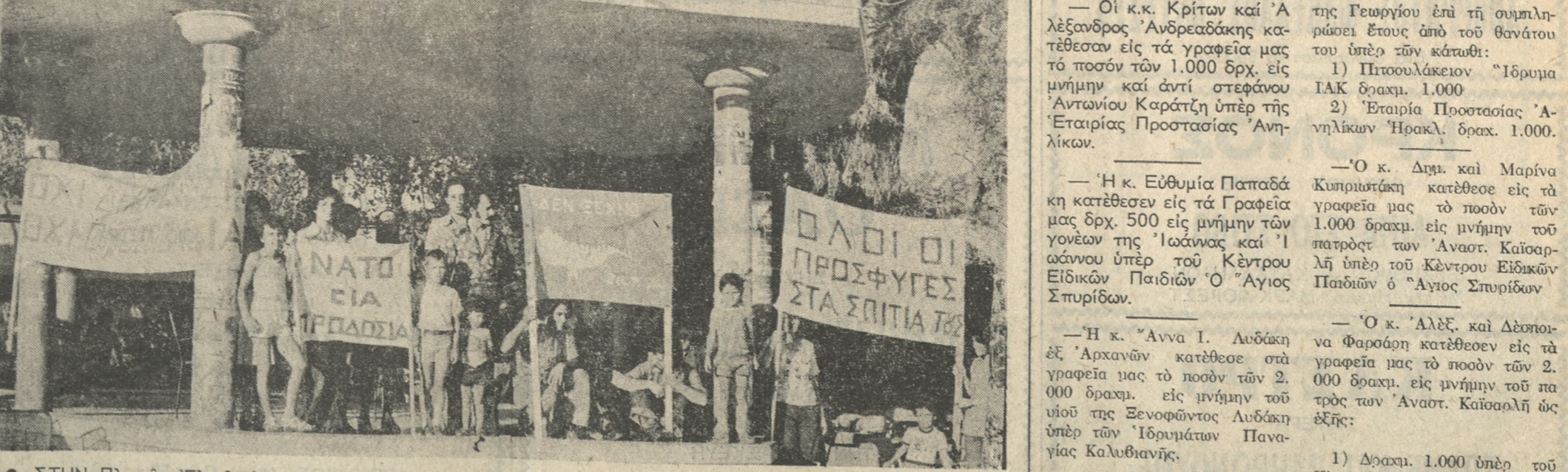
• ΣΤΗΝ Πλατεία Έλευθερίας συγκεντρώθηκαν χθές Κύπριοι και Κυπριαστίοι που βρίσκονται σόν Έρακλειο —κυρίως σάν σπουδαστές τών ΚΑΤΕ— και έκαναν σιωπηλή διαμαρτυρία γιά τήν κατάσταση που ύπάρχει σόν νησί. Οι συγκεντρωθέντες κρατούσαν και τά πανώ που βλέπεται στήν φωτογραφία μας. Φωτορεπορτάζ: Γ. ΒΑΖΟΣ Τηλ. 288-357