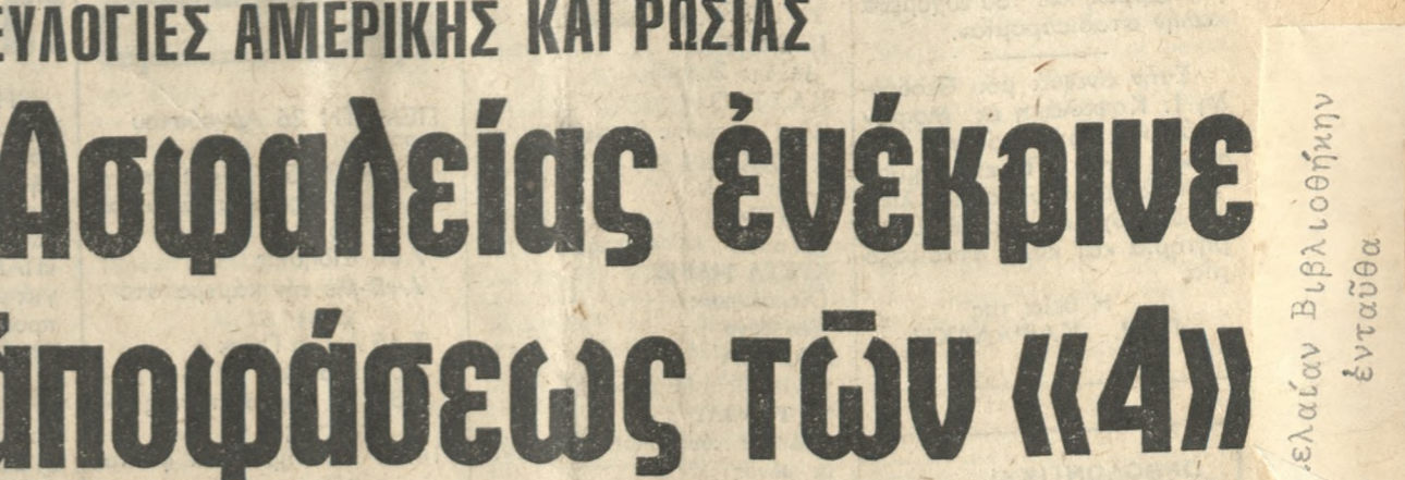
Λεωνίδας Βιβλιούσηνην ένταυθα