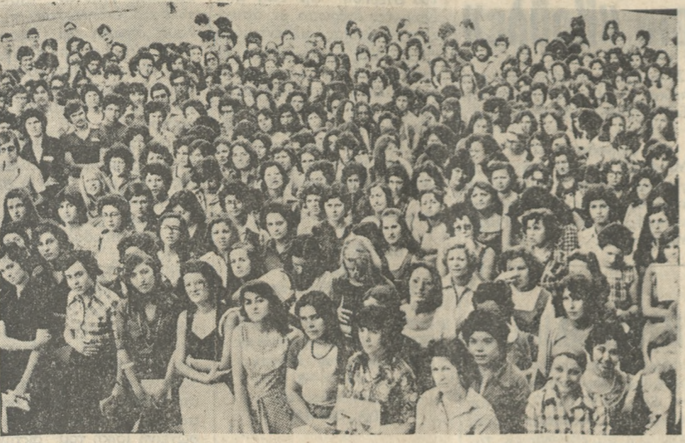
ΜΕ άισιοδοξία προσήλθαν χθές γιά τίς εξέτασεις στήν Α.Ε.Ι. οι ύποψήφιοι και ύποψήφισες τού 'Ηρακλείου. Καί ή άισιοδοξία αύτή διακρίνεται στήν προσπάθειά τους. Καλή έπιτυχία, παιδιά.