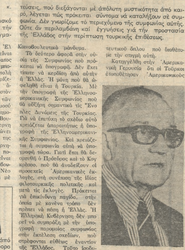
Παραύλους στις άκτές του Αιγαίου και άπένα στα Έλληνα νησιά. Δέν μας ένδιαφέρει άπό πός έπαισαν τούς Ά-

Σ. Σταυρακάκης Τηλέφ. 288-357.