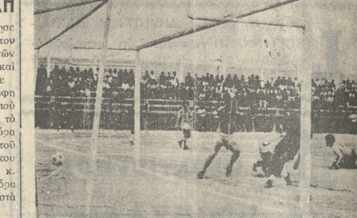
Ο Παπαγιώλης από κοντά στέλνει τήν μπάλα στή δικτύα τού 'Ηλυσιακού.

—Κόσταν 2.111 εισιτήρια και εισπραχθήκανε 211.100 άρα.