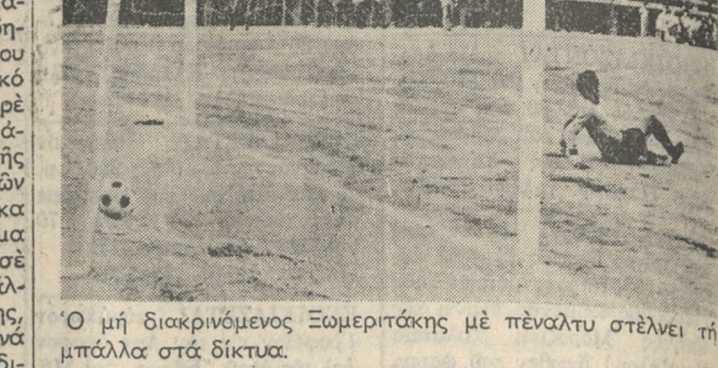
Ο μη διακρινόμενος Ξομεριτάκης με πέναλτυ στέλνει τήν μπάλα στή δικτύα.

ΣΤΟΝ τελευταίο φιλικό άγώνα τού, πριν από τήν έναρξη τού πρωταθλήματος, ο ΟΦΗ κέρδισε προχθές στή γήπεδό φάνηκε γιάτί άπ' ένός μεν έλλειπαν βασικά στελέχη τού, άπ' άλλου δε γιάτί οι φιλοενούμενοι έφάρμοζαν τό τεχνι-