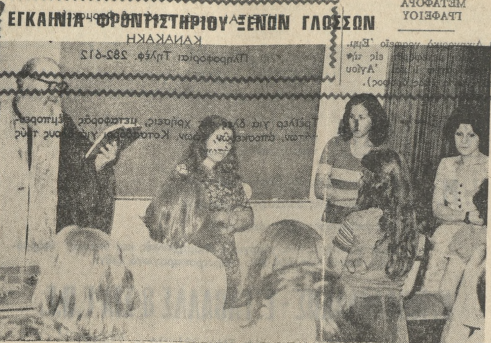
ΤΟ πρωί της Κυριακής έγιναν τα εγκαίνια του νέου Φροντιστηρίου Ξένων Γλωσσών...