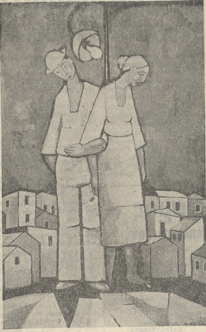
«Κάτω άπ' τό Φανάρι» ένα από τά έργα τού 'Αριστείδη Βλάσση.

Θά μπορούσε ν' αναζητήσει κανείς τίς πηγές της εμπνεύσεως τού 'Αριστείδη Βλάσση στή θυζαντινή εικονογραφία και στή λαϊκή τέχνη, άν ή δυνατή προσωπικότητα τού καλλιτέχνη δέν μετουσίωσε όλα αυτά για να εκφορσεί τό δράμα τού οε μιά γλώσσα πού να πληθαίνει πρός τόν εξπρεσιονισμό και τόν κυβισμό. Δέν εξπρεσιονισμό, όα γιατί νομίζομε ότι ό 'Αριστείδης Βλάσσης άντλεί τά δεδομένα της ζωγραφικής του από αυτά τη Σχολή, με μόνιμα για να επισημάνω πόν τρόπο με τόν όποιο χορηγοποιεί τό κρημα με σμυσιανή σφράματα και οχεδιάζει τίς μορφές του με άδρες και ρωπαλές γραμμές. Όσο για τήν αναφορά μου στόν κυβισμό, θέλω με αυτή να τονίσω τόν τρόπο με τόν όποιο ό καλλιτέχνης οργανώνει τίς μάζες και τούς όγκους του οε σύνολα καλά διαρθρωμένα, πράγμα πού εκφράζει τόν αρχιτεκτονικό χαρακτήρα της ζωγραφικής του καθώς και τίς συνθετικές του ικανότητες από τίς όποιες πηγάζει ή αίσθησι της ισορροπίας και της δυνάμεις πού μας δίνουν τά έργα του.