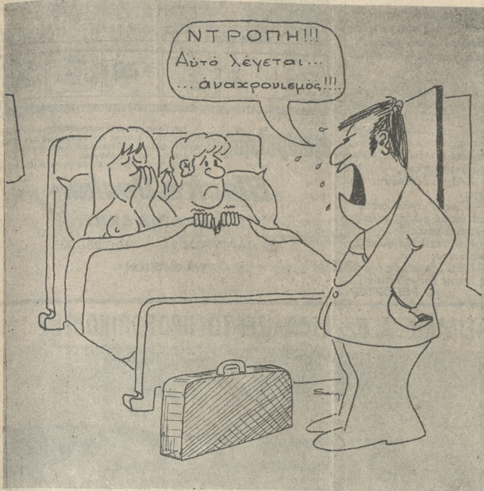
(Του ΒΑΓΓΕΛΗ ΣΑΜΑΡΑΚΗ)