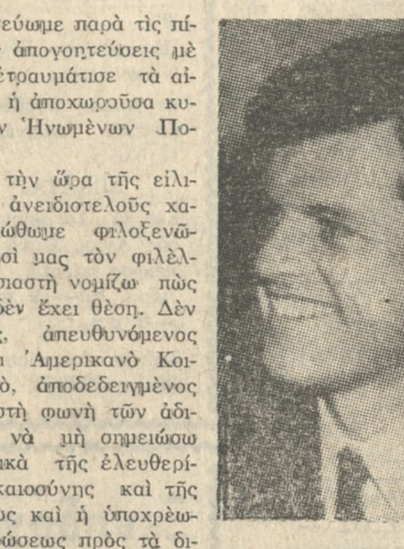
μικά συμπεφοντα τών όλιγων. ‘Ο γερουσιαστής ‘Εντουαρντ Κέννεντυ είναι άπό τούς

σια, και τήν άλλη ‘Αμερική, πέρα άπ' αούτην πού μάς άπόψήσε σε μιά τραγωδία, και μάς έγέμισε τήν ψυχή με όργή και πικρία. Τήν ‘Αμερική πού έγγραψε ιστορία και πρωσοπάτησε στην πρόοδο τής άνθρωπότητας. Τήν ‘Αμερική με τόν φιλελεύθερο Λαό, πού κι' αούτός τό ίδιο με μάς έδωσεν τή μάχη του και νίκησε γιά να συνεχίσει να γράφει ιστορία κεφαλή τής προοδευτικής πορείας τών εθνών. Αούτό τό πολλαπλό νόημα δίδει στή σημερινή εκδήλωσή του ό Λαός τής Κρήτης, ό Λαός τού ‘Ηρακλείου, κολλωσρίζοντας άπό καρδιάς τόν ‘Εντουαρντ Κέννεντυ.