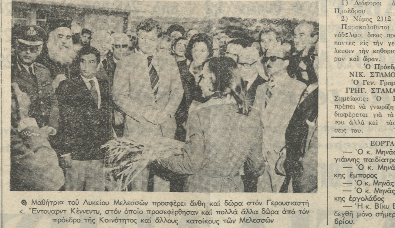
Μαθήτρια του Λυκείου Μελεσσών προσφέρει άνθη και δώρα στον Γερουσιαστή κ. Έντουαρντ Κένεντυ, στον οποίο προσεφέρθησαν και πολλά άλλα δώρα από τον πρόεδρο της Κοινότητας και άλλους κατοίκους των Μελεσσών.