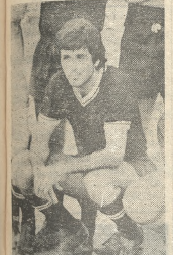
ΔΗΜ. ΜΠΕΝΣ Διακρίθηκε ιδιαίτερα την Κυριακή.

ΤΟ ΜΑΤΣ ΑΡΧΙΖΕΙ ● ΣΤΙΣ 2.30' άκρως ο δεξιός κ. Λέκκας (Μπαλής - Σούλης), κάλεσε τις ομάδες