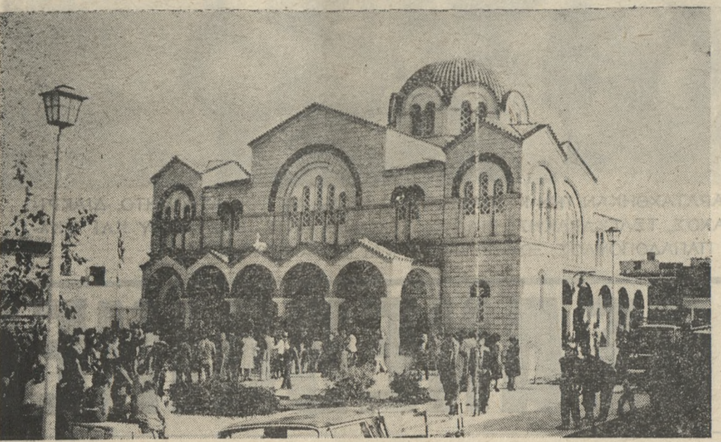
● Τήν Κυριακή τό πρωί ό Σεβ. 'Αρχιεπίσκοπος Κρήτης κ. Εύγένιος έγκαινίασε τόν 'Ιερό Ναό τής 'Αγίας Βαρβάρας (φωτογραφία) τού συνοικισμού Καραολή Καμίνια, παρουσία πλήθους ένοριτών.