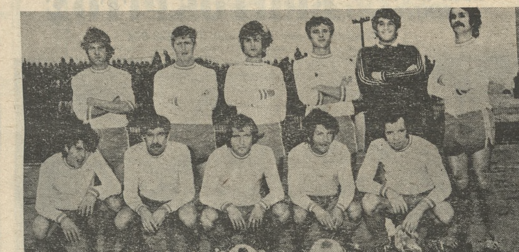
ΣΤΟ ΤΟΠΙΚΟ ΠΡΩΤΑΘΛΗΜΑ Α' ΚΑΤΗΓΟΡΙΑΣ 'Εργοτέλης, Ποσειδώνας Π.Ο.Α. και Ε.Γ.Ο.Η. κέρδισαν