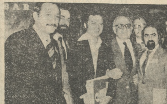
Η ά.π.πρωτοειία της ΕΔΗΚ έξωτερικού με τον Αρχηγό κ. Γ. Μαύρο στο κέντρο σ' ένα διάλειμμα της Συνδιάσκεψης.

Πατριπαράδοτη φιλία συνδέει τη χώρα μας με τις άραδικές χώρες. Οι σχέσεις μας με αυτές έξελίσσονται κατά τρόπο ικανοποιητικό. Θα προώθησμε τη βελτίωση των σχέσεων αυτών σ' όλους τους τομείς και ή διαίτηρη στον οικονομικό, στον όλοιο παραουσιάζονται μεγάλης άποδοτικότητας έπιχειρήσεις συνεργασίας προς άμοιβαίο όφελος. Άλλά και στον τομέα των πολιτικών,