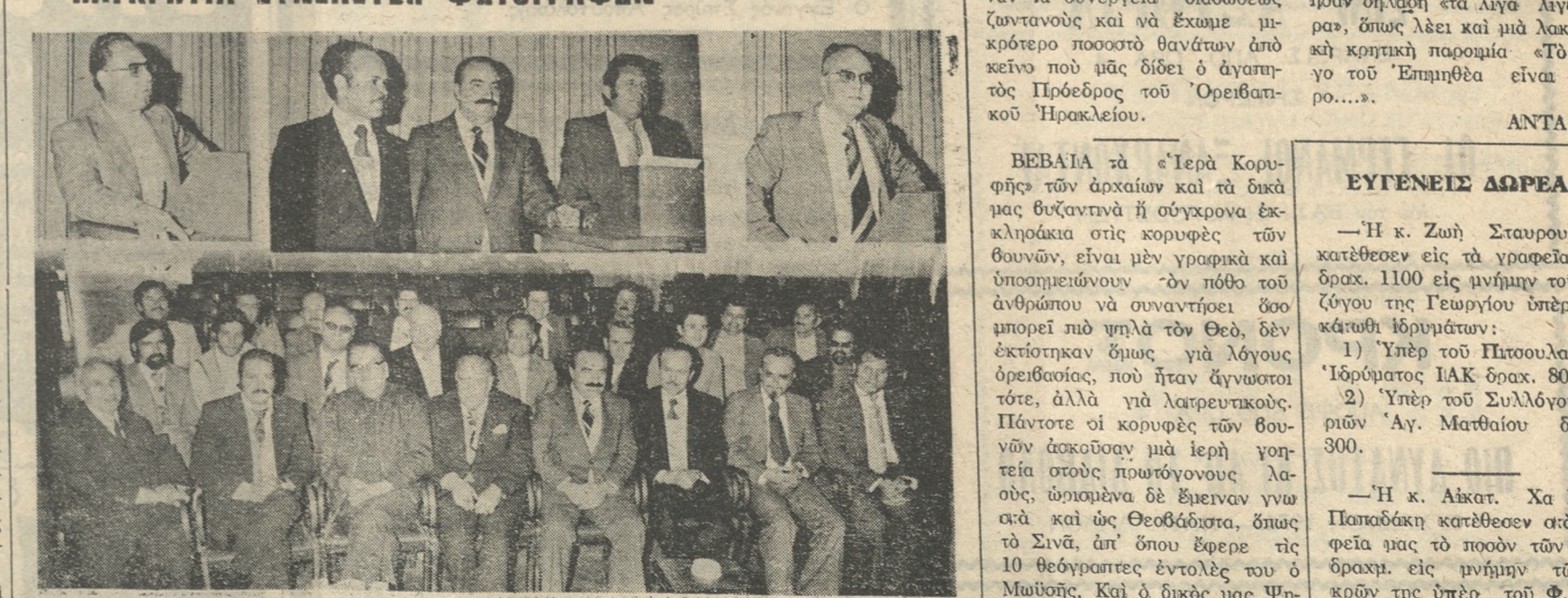
Γενική Συνέλευση των Φωτογράφων της Κρήτης πραγματοποιήθηκε προχθές στην αίθουσα του Έπαγγελματιοβιοτεχνικού Έπιμελητηρίου Ηρακλείου. Θέμα της Συνέλευσεως ήταν να ληφθούν αποφάσεις για τη δημιουργία ενός όργανου που να εκπροσωπεί όλους τους Φωτογράφους, και ή ίδρυση Καταστήματος Φωτογραφικών Ειδών για τά μέλη, έργαστηρίου έμφανίσεως έγχρωμων φίλμς και άλλα κλαδικά θέματα. Στη Συνέλευση παρευρέθησαν και ή ηγεσία των Έπαγγελματιοβιοτεχνικών Ηρακλείου, όπως φαίνεται στην παραπάνω φωτογραφία που είναι ένα στιγμιότυπο από τη Συνέλευση.