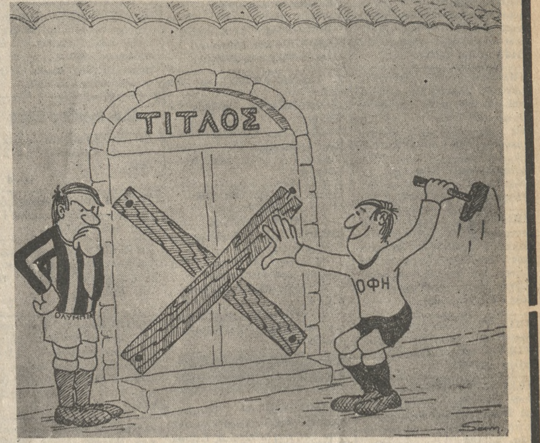
ΟΦΗ - ΟΛΥΜΠΙΑΚΟΣ ΠΕΙΡ: Χ (ΤΟΥ ΒΑΓΓΕΛΗ ΣΑΜΑΡΑΚΗ)

● Ο ΠΡΟΕΔΡΟΣ του Συνδέσμου Φίλων του Ο.Φ.Η. κ. Πεπονάκης έκανε τις παρακάτω δηλώσεις: «ΤΗΝ Κυριακή ο Ο.Φ.Η. διπλή νίκη κατήγαγε. ΕΙΣ τόν άθλητικόν του μεά ο ποδοσφαιριστάί έπεισαν και τόν πλέον δίσπιστον διά την άξίαν της όμάδος και έδωσαν τό δικαίωμα να πιστέψω με ότι δυνάμεθα εις τό προσεχές μέλλον και έμεις να κάναμε πρωταθλητισμό. Οι φιλάθλοι της Κρήτης βροντοφώνησαν με την άσφογη άθλητική άνωτερότητά των ότι ή Κρήτη είναι πολύ μεγάλη και γενναία και εις τούς κόλπους της δεν μπορούν να εισορήσουν οι εκ του κέντρου βρωμιές και προβοκάτσεις. ΖΗΤΩ ό ηρωικός ΟΦΗ. ΖΗΤΩ ή άθάνατη Κρήτη».