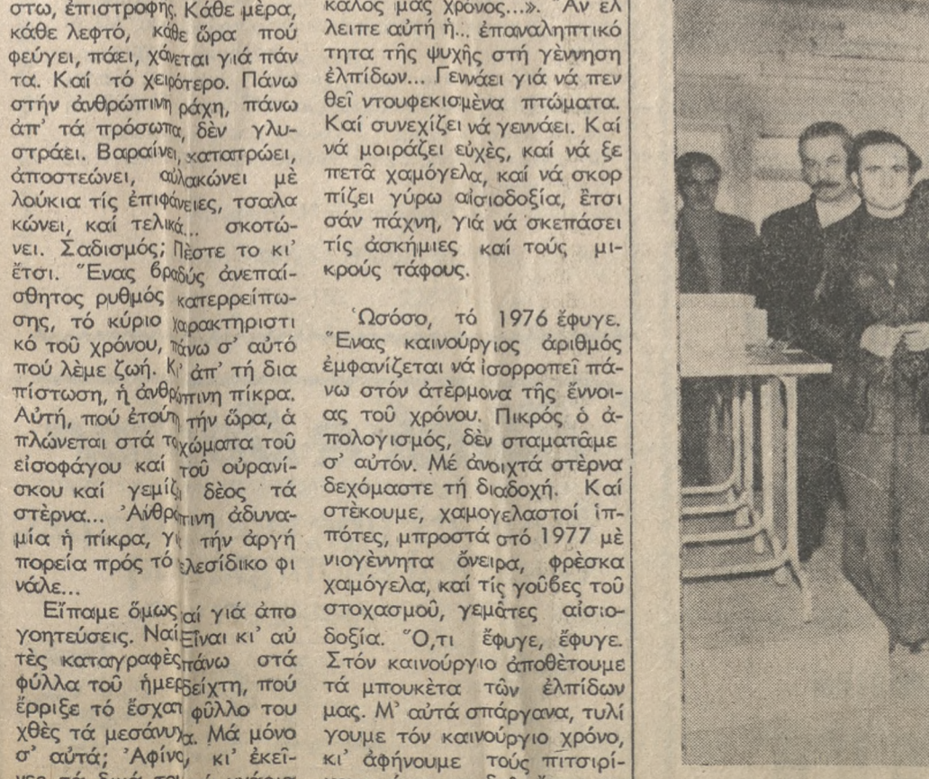
Γιορτή στή Λέσχη Δημοσίου ύπαλλήλων χθές. Τά παιδιά Δημοσίου και Δημοτικών ύπαλλήλων δεξιώθηκε χθές ο Νομάρχης Ηρακλείου κ. Καραγκουνίδης, και ύστερα άπό τό κόψιμο πίτας, τούς μοίρασε και διάφορα δώρα. Στή φωτογραφία ο κ. Νομάρχης περιτοιχούμενος άπό ύπαλλήλους τής Νομαρχίας.