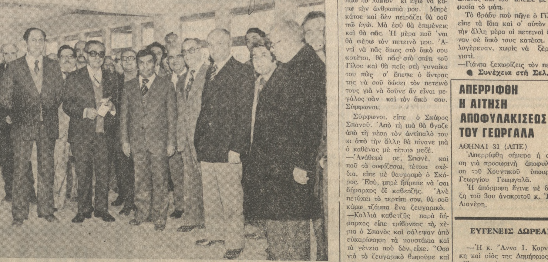
Γιορτή στή Λέσχη Δημοσίου ύπαλλήλων χθές. Τά παιδιά Δημοσίου και Δημοτικών ύπαλλήλων δεξιώθηκε χθές ο Νομάρχης Ηρακλείου κ. Καραγκουνίδης, και ύστερα άπό τό κόψιμο πίτας, τούς μοίρασε και διάφορα δώρα. Στή φωτογραφία ο κ. Νομάρχης περιτοιχούμενος άπό ύπαλλήλους τής Νομαρχίας. Φωτογραφία Β. ΔΡΟΣΟΣ Τηλ. 221-830