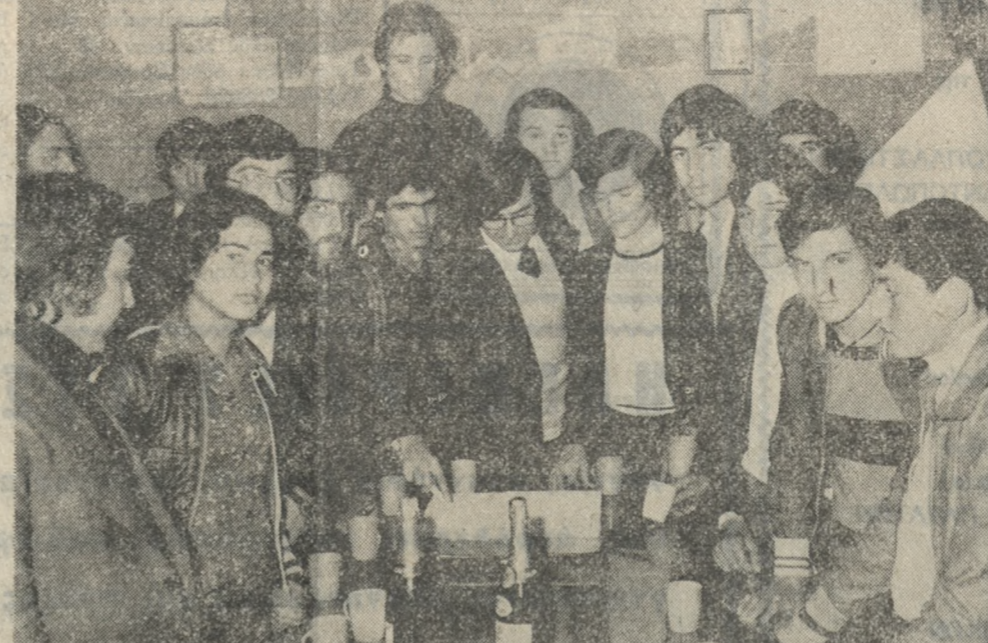
Προχθές το βράδυ οι ιστορικοί ποδοσφαιρικοί σύλλογοι «Ηρακλής» έκομα την πίτα του, από την έκδηλωση δε αυτή είναι και ί το παραπάνω στιγμιότυπο.