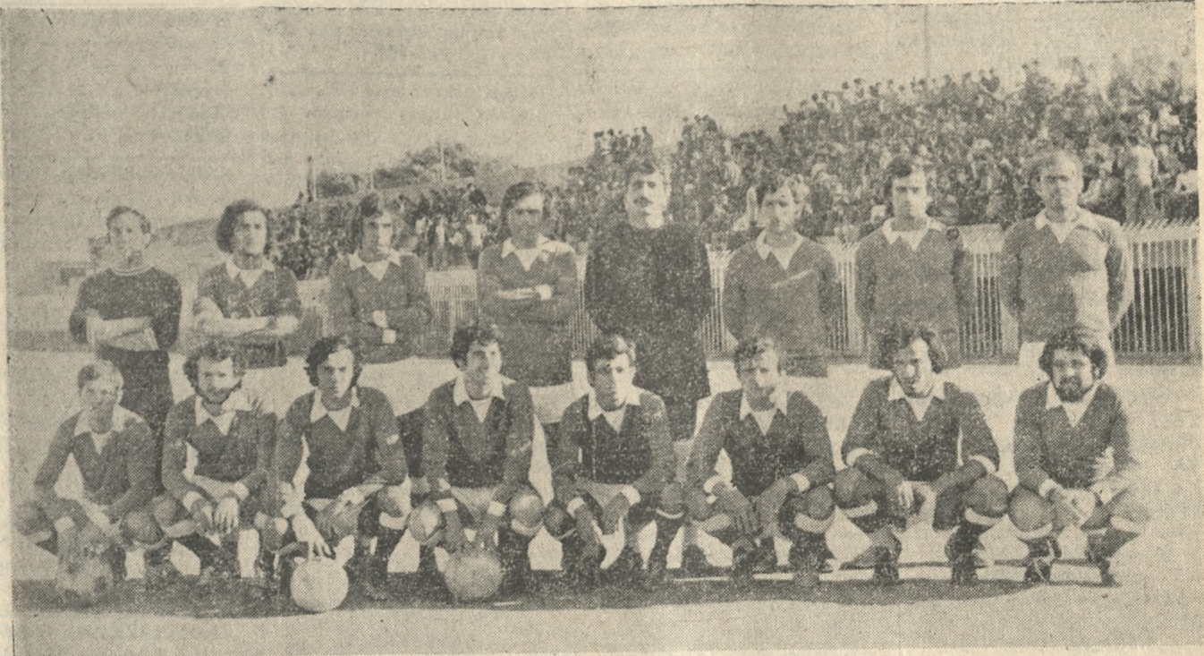
Ἡ δημοφιλὴς ομάδα τοῦ Ποσειδῶνα πού ἐξέφυγε τρεῖς βαθμούς μπροστά καί βλέπει τώρα ἀφ' ὑψηλοῦ τόν τίτλο.