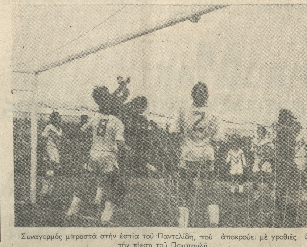
Συγκρούσι μπροστά στήν ἔστια τοῦ Παντελῆ, πὸν ἀποκρούει με γροθιές ὑπὸ τὴν πίεση τοῦ Παμπούλη.

ΜΕ τὴν ἐναρξη τῆς ἐπαναλλήψως ὁ Ἡρόδοτος ἔγινε ὁ πρωταγωνιστὴς τοῦ ἀγῶνος, ἀν καί ἔεκίνησε με ἕνα τραυματισμὸ. Ὁ Κεφαλοῦκος (48') ἔπρεπε σὸ κινεζοῦ καί κτύπησε σὸν τριχωτὸ τῆς κεφαλῆς. Ὁ