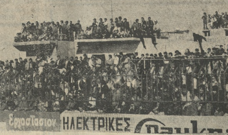
Τό γήπεδο είναι μικρό καί οι φιλάθλοι αναζητούν μιά θέση στις γύρω ταράτσες. Καί αυτοί ταλαιπωρούνται αλλά καί ο ΟΦΗ χάνει ένα σοβαρό έσοδο.

● ΝΙΚ. ΛΕΜΟΝΗΣ (προπονητής ΑΕΚ): Με τήν νίκη μας επί του ΑΟΑΝ μέσα στον Άγιο Νικόλαο δείξαμε τήν άξία μας. Ευχαριστώ όλα τά παιδιά για τί με τρεις λέξεις: «Ένεργούν σάν επαγγελματίες».