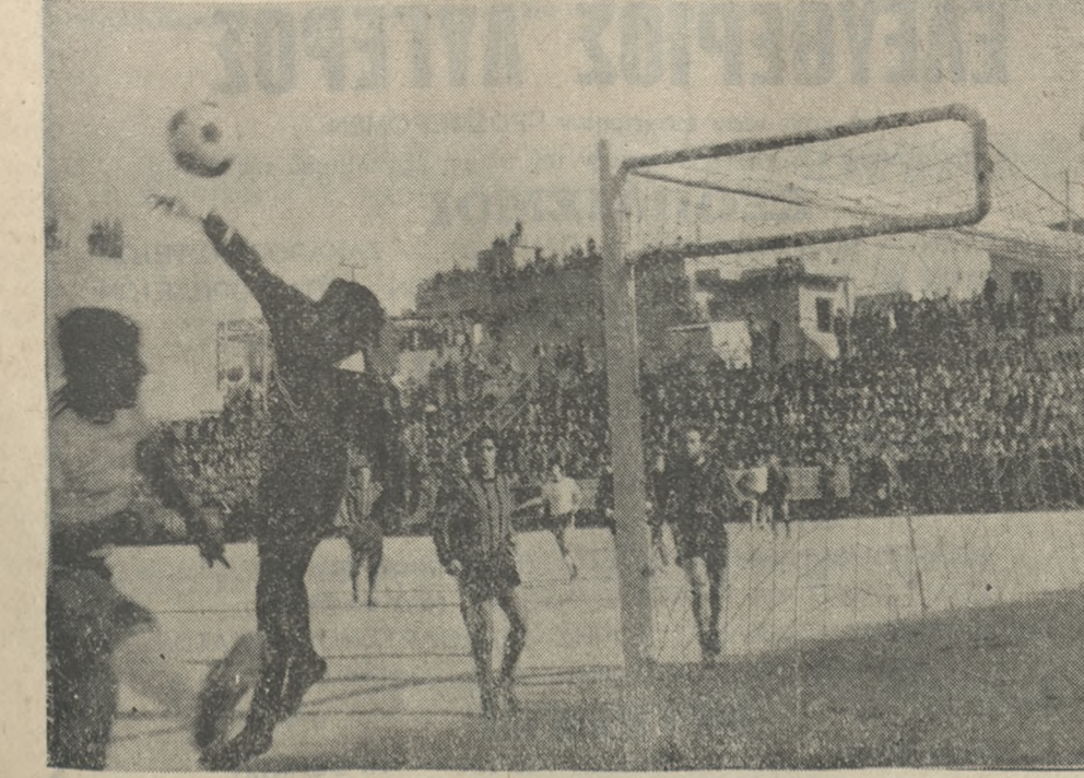
Ο Οικονομόπουλος διώχνει τήν μπάλλα πρό του Κορωνάκη από κόρνερ του Ρέλλη.

ΕΙΣΙΤΗΡΙΑ ΚΑΙ ΕΙΣΠΡΑΞΕΙΣ ● ΣΤΟΝ χθεσινό αγώνα ΟΦΗ — Παναχαϊκής κόπηκαν 6715 εισιτήρια καί εισπραχθηκαν 621.480 δραχμές. Φωτογραφικό Ρεπορτάζ: Ν. ΜΑΛΤΕΖΑΚΗ Τηλ 281-396 ΠΑΡΕΝΗΝ Φάτο Έλλη Τηλ 285-164