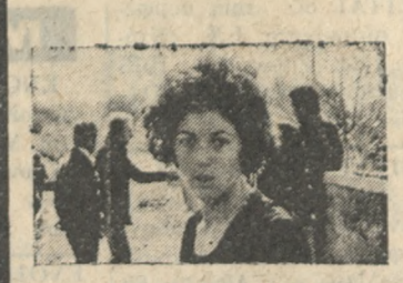
Η ΖΑΛΟΚΩΣΤΑ πού ήλθε πέμπτη

ΑΠΑΡΑΔΕΚΤΟ Ο Ηρόδοτος δέν είχε θεωρήσει τά δελτία ύγείας καί δέν έγινε τό μάτς στην Κόρινθο ● ΑΠΑΡΑΔΕΚΤΟ για ομάδα Β' Έθνικής Κατηγορίας είναι αυτό πού έπαθε τήν Κυριακή ο Ηρόδοτος. Δέν είχε θεωρήσει τά δελτία ύγείας τών ποδοσφαιριστών του καί έτσι ο διαιτητής κ. Χαϊρόπουλος δέν δέχτηκε νά γίνει ο αγώνας πός τήν Κόρινθο, αφού ο Ηρόδοτος δέν ήταν σύμφωνος με τό «γράμμα του Νόμου». Δέν έπιτρέπεται ένα σωματείο Β' Έθνικής νά πέρτει σέ τέτοιες γκάφες. Τέτοια σφάλματα δέν συγχωρούνται ούτε σε σωματεία δικαίως κατηγορίας. Πολύ περισσότερο δέν συγχωρούνται για τόν Ηρόδοτο πού δίνει μάχη άπελπισίας για νά άποφύγει τόν ύποβιβασμό. Στην Άλικαρνασσό ή είδηση αυτή έπασε σάν βόμβα καί έφερε τήν λυπή καί τήν όργή στους φιλάθλους, οι όποιοι δέν συγχωρούν με κανένα τρόπο τήν άπερισκεπεία τών άρμοδίων. Τώρα αρχίζει ένας αγώνας για τόν Ηρόδοτο. Στο βάθος ο αγώνας αυτός είναι ΔΙΚΑΙΟΣ γιατί ο διαιτητής εξάντλησε όλη τήν αυστηρότητα του, έδειξε τήν αντίπαθεία του πρός τόν Ηρόδοτο καί τού στήριξε τό δικαίωμα νά αγωνισθή. Πιστεύομε ότι τελικά ο Ηρόδοτος θά δικαιωθή από τό Α. Σ.Ε.Α.Δ. καί τό μάτς θά ξαναγίνει. Ρωτάμε, όμως, πούς έχει τό δικαίωμα νά βάζει σέ τέτοιες περιπτώσεις τόν Σύλλογο, γιατί δέν θυμήθηκε νά στείλει 16 δελτία σέ κάποιο γιατρό νά τά θεωρήσει; Μπορεί κανείς νά δώσει άπάντηση. Πολύ άμφιβάλομο.