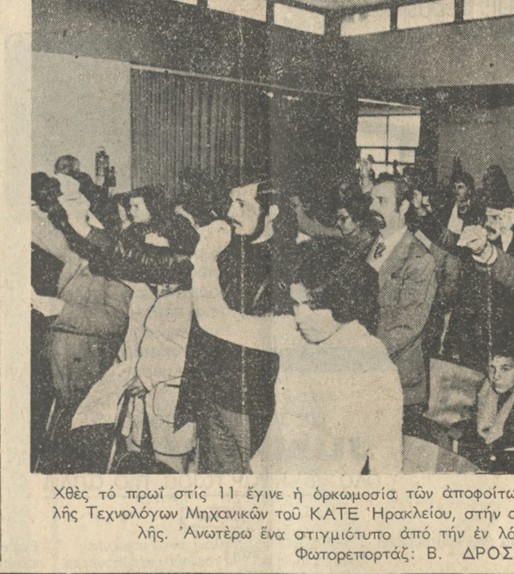
Χθές τό πρωί στις 11 έγινε η όρκωμοσία των άποφοίτων σπουδαστών της Σχολής Τεχνολογών Μηχανικών του ΚΑΤΕ 'Ηρακλείου, στην αίθουσα τελετών της Σχολής. Άνωτέρω ένα στιγμιότυπο από τήν λόγω εκδήλωση.