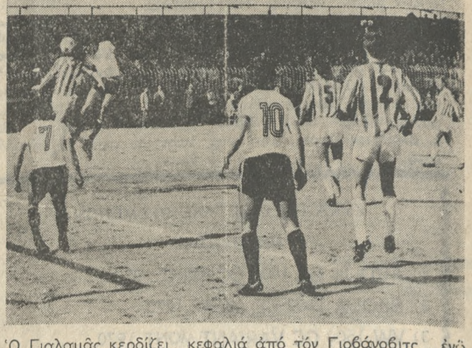
Ο Γαλαξίας κερδίζει κεφαλιά από τον Γιόβανοβιτς, ένός παρακολουθούν την φάση οι Παμπούλης, Παπαδόπουλος, Γεϊλικίτης και Μπόροβιτς.

2. Ο 'Ερμού 'Αστέρα δεν ήθελε να έκτεθή και κινήσει την νίκη.