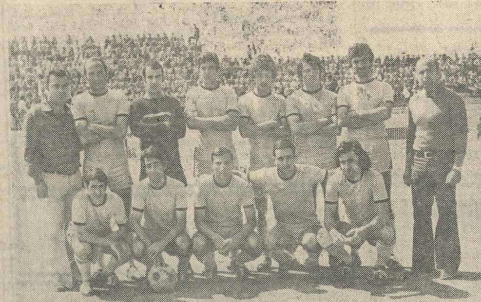
Ο δημοφιλής 'Εργοτέλης όπως παρατάχθηκε τήν Κυριακή στό μάτε με τόν 'Ιωνικό (0-0).

ΣΤΟΥΣ άγώνες της Κυριακής σημειώθηκε ή παρακάτω εισπρακτική κίνηση: ΟΦΗ — Σεργός: Εισιτήρια 3.730, εισπράξεις 857.440 δραχ. 'Ηρόδοτος — Καλλιθέα: Εισιτήρια 650, εισπράξεις 20.000 δραχ. 'Εργοτέλης — 'Ιωνικός: Εισιτήρια 1654, εισπράξεις 80.300 δραχ.