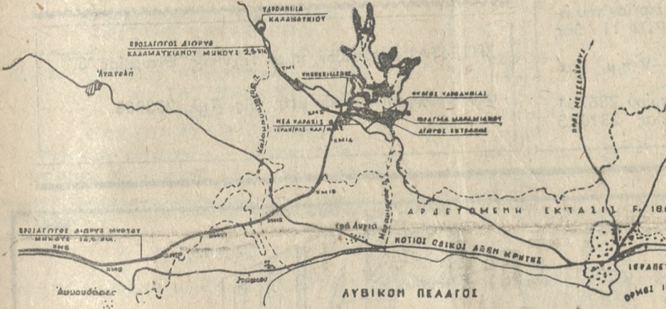
Η γενική διάταξη τών έργων του φράγματος Μπραμριανού. Διακρίνεται το φράγμα, οι προσαγωγές διώρυγες και η περιοχή που θα ποτίζεται απ' αυτό.