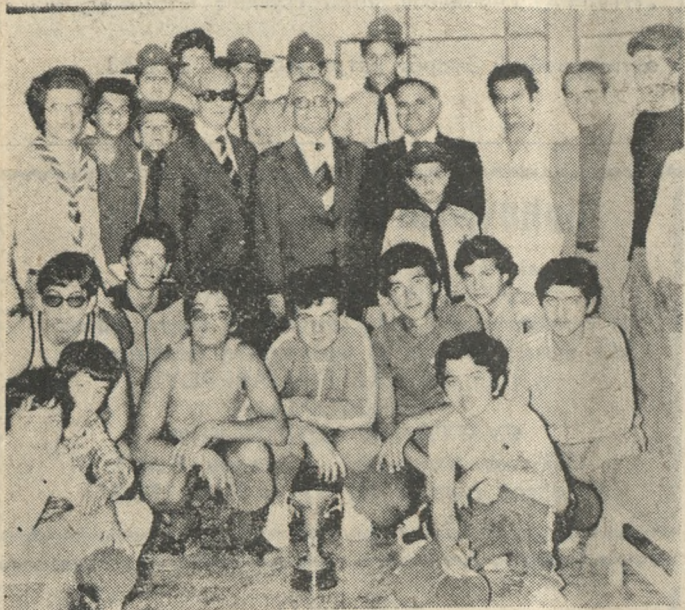
Ένα στιγμιότυπο ληφθέν μετά τους Παγκρητίους αγώνες επίτραπέζιου αντισφαίρισης (πίνγκ-πόγκ) που διεξήχθησαν στην Κυριακή στη Λεσχή προσκοπικού του ΟΤΕ.