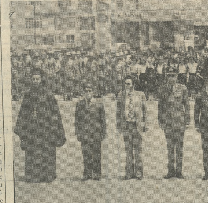
Οι έπίσημοι στην χθεσινή κατωστάσε στεφάνων στο 'Ηρώ τής Μάχης της Κρήτης.