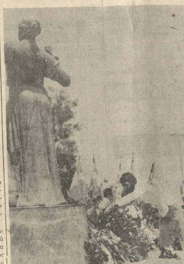
Ένα στιγμιότυπο από τήν χθεσινή κατωστάσε στεφάνων της σπουδάσεως νεολαίας. Φωτορεπορτάζ: Ν. ΜΑΛΤΕΖΑΚΗΣ τηλ. 281396