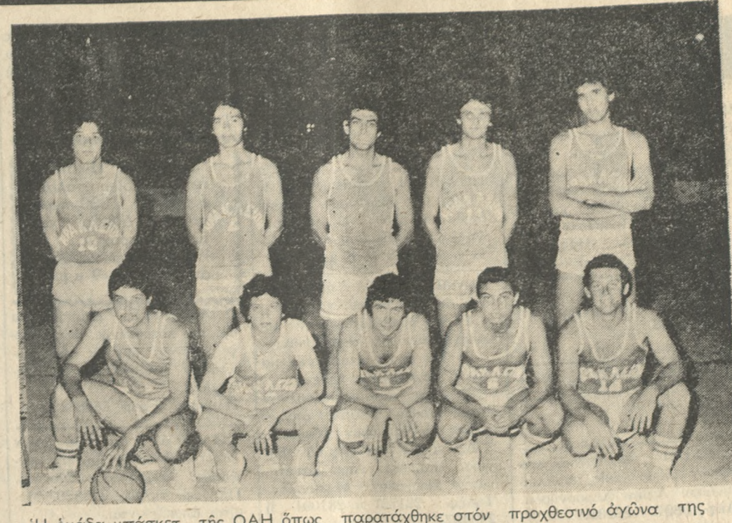
Η ομάδα μπάσκετ της ΟΑΗ όπως παρατάχθηκε στον προχθεσινό αγώνα της με την Γλυφάδα.