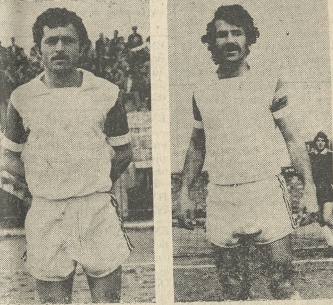
Στα πλαίσια των προκριματικών ο Εργυτέλης συνέτριψε τον Παναυπλίου 5-0