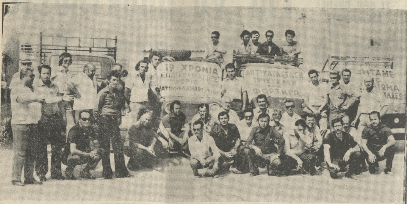
Μέλη του Σωματείου Τρικυκλών Δ.Χ. συγκεντρωμένα μπροστά στα όχημά τους κατά την χθεσινή 24ωρη προειδοποιητική απεργία τους, για την ικανοποίηση των δικαίων αιτημάτων τους.

ΤΟ ποτήρι είχε ξεχλωθεί. Ο εργαζόμενος έδει φρόσιτο στο κατακόρυφο. Τα αιτήματα είναι πέρα για πέρα ΔΙΚΑΙΑ. Αλλά κανείς δεν οκείθηκε ποτέ να τα ικανοποιήσει. Αλλά έστω απλώς να τα μελετήσει. Και έτσι τα μέλη του Σωματείου Τρικυκλών Δ.Χ. αναγκάστηκαν χθες να κατέβουν από 24ωρη προειδοποιητική απεργία.