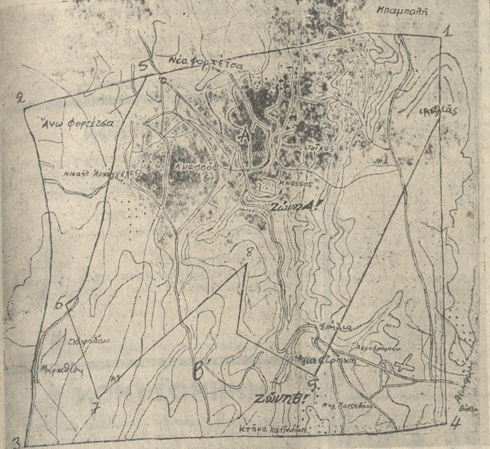
ΣΤΗΝ ΠΕΡΙΟΧΗ ΦΟΡΤΕΤΖΑΣ ΚΑΙ ΑΛΛΟΥΣ ΟΙΚΙΣΜΟΥΣ

ΣΑΒΒΑΤΟΝ 28 ΜΑΪΟΥ 1977 ΓΡΑΦΕΙΑ — ΤΥΠΟΓΡΑΦΕΙΑ 'Οδός Θεσσαλονίκης 2 Τ.Θ. 160 ΤΗΛ. Διευθύνσεως: 286-455 Συντάξεως: 282-625 ΗΡΑΚΛΕΙΟΝ — ΚΡΗΤΗΣ