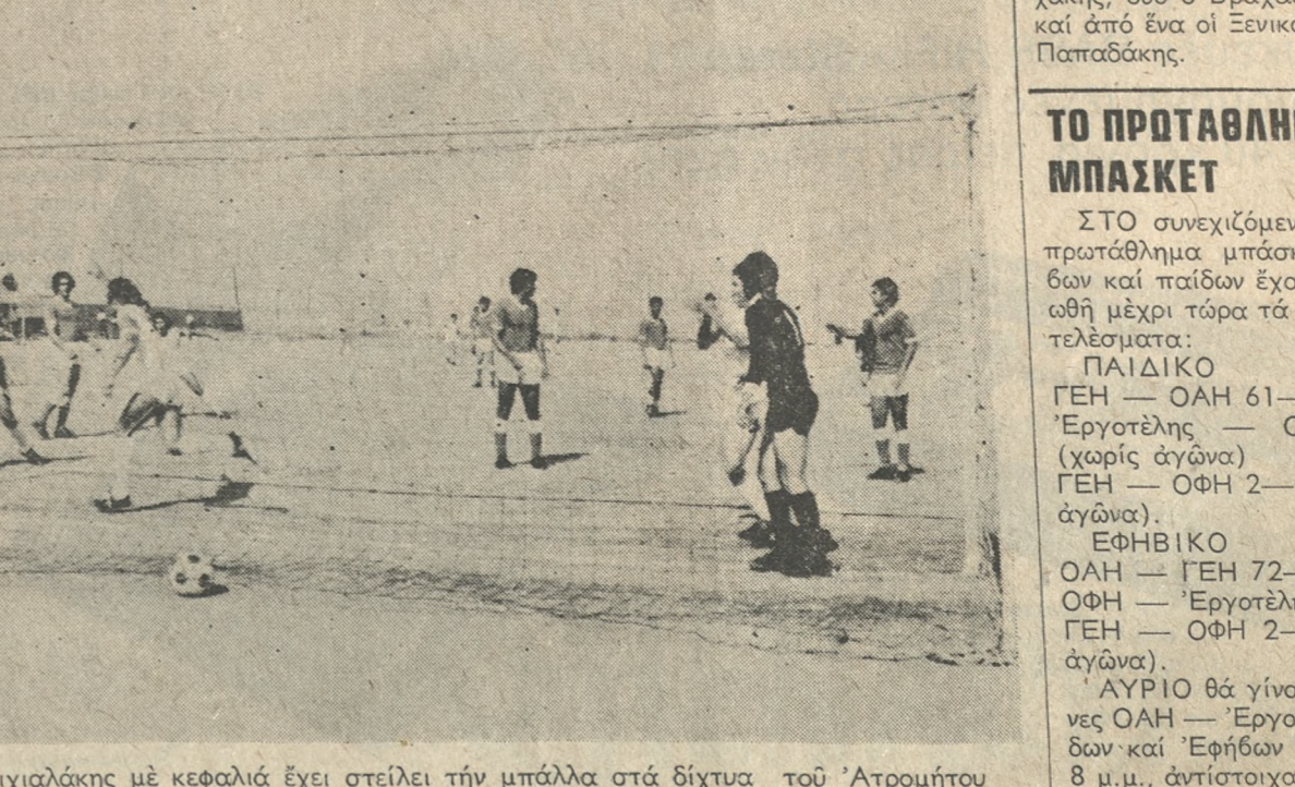
Ο Μιχαλάκης μέ κεφαλή έχει στείλει τήν μπάλλα στά δίχτυα τού 'Ατρομήτου και τρέχει νά πανηγυρίσει μέ τούς συμπαίκτες του τό πρώτο γκόλ τού 'Ηρόδουτ