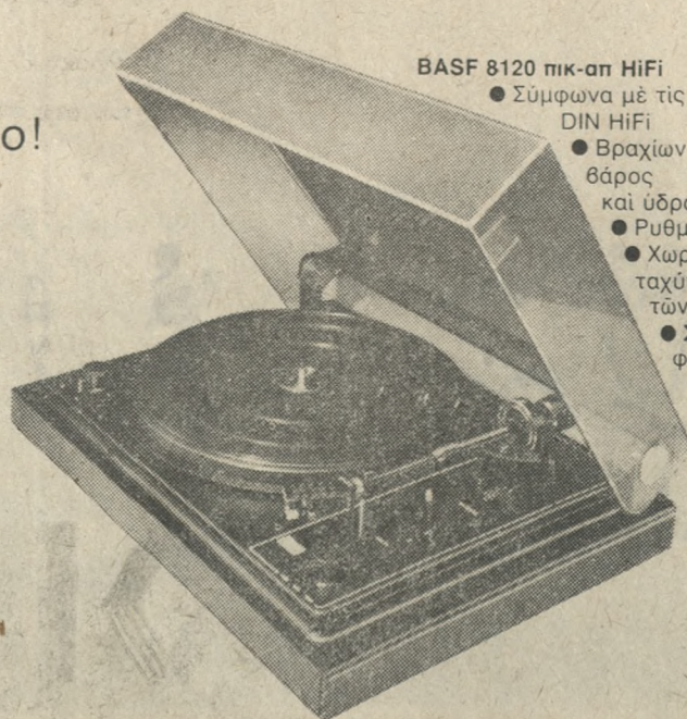
BASF 8120 HiFi