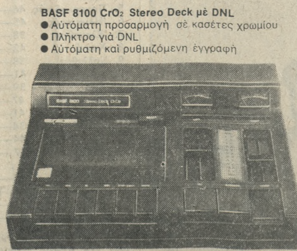
BASF 8100 CrO 2 Stereo Deck με DNL