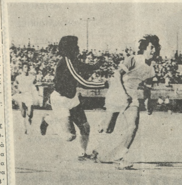
‘Ενα στιγμιότυπο από τόν αγώνα 'Ηροδότου — Κορωπί (4—1) για τό πρωτάθλημα Β' 'Εθνικής Κατηγορίας.