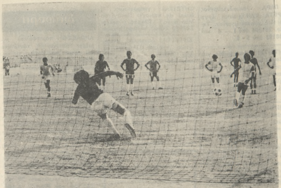
‘Ο Μικιαλάκης ξεγελά τόν Παππά και στέλνει τήν μπάλλα στα δίχτυα. Είναι τό τέταρτο γκόλ του 'Ηροδότου, που σημειώνεται με πέναλτυ.