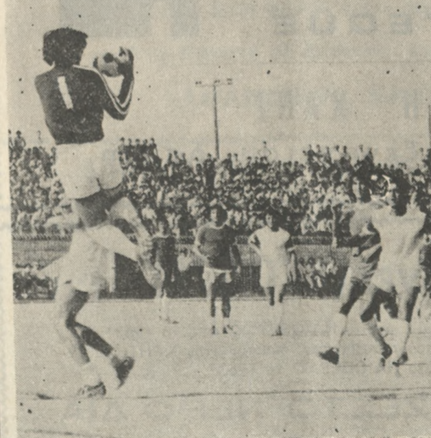
‘Ο τερματοφύλακας του Κορωπί άποκρούει, ύποστηρίζόμενος από συμπαίκτης του.