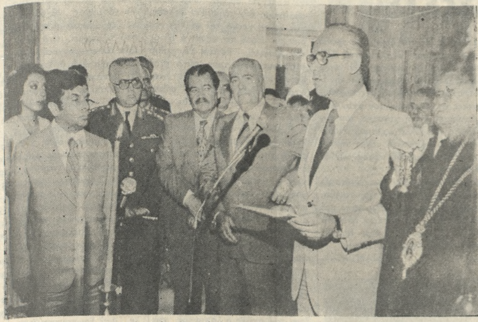
Ένα στιγμιότυπο από τα χθεσινά έγκαίνια του νέου Υποκαταστήματος της Γενικής Τραπεζής της Ελλάδος. Φωτορεπορτάζ: Β. ΔΡΟΣΟΣ τηλ. 221830