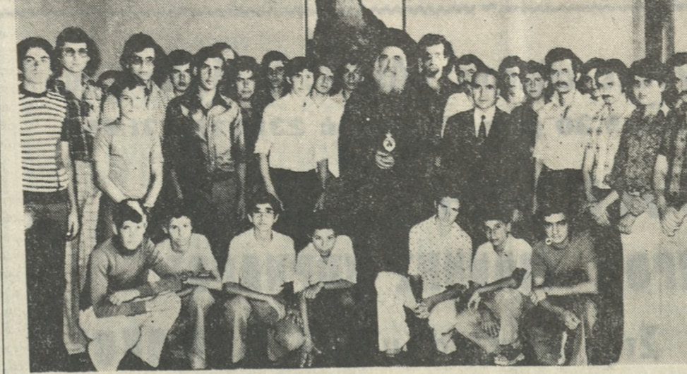
Μέ τή λήξη τού σχολικού έτους χθές, τρόφιμοι τού Οικοτροφείου 'Αρρένων τής 'Αρχιεπισκόπης Κρήτης έπισκεψθήσαν τόν Σεβ. 'Αρχιεπίσκοπο κ. Ευγένιο τόν άποιο καί εύχαρίστησαν καί φωτογραφήκαν μαζί του.