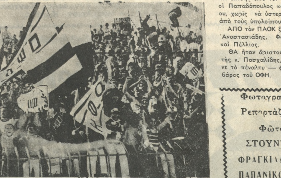
Αυτός είναι ο μεγάλος λαός του ΟΦΗ, ή δύναμη του Ήρακλειώτικου σωματείου. Σ' αυτόν τον λαό ο ΟΦΗ χρωστάει πολλά.