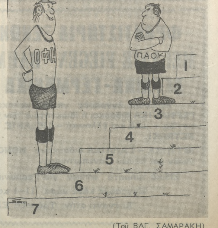
(Τού ΒΑΓ. ΣΑΜΑΡΑΚΗ)