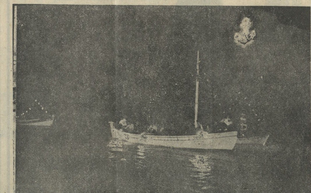
Νύχτα και φώς. Η κορύφωση και τό φινάλε λαμπρού και πολύχρωμα φωτεινού, της Ναυτικής Έβδομάδας, τό θράδι της Κυριακής στό λιμάνι τού Ηρακλείου. Ένα καικι φωτισμένο άπ' τούς χειμάρρους τών γεφυρών και τών προβολέων, και μία φλεγόμενη άγκυρα στό κρασπέδο τού Ένετικού Κάστρου. Και πίσω τό μαθύ πέλαγο κι ο μελανός όρίζοντας.

Ήταν ή ώρα για την έπισημύση δέση, την όποια έτέλεσε εκπρόσωπος τού Άρχιπισκόπου = Συνέχεια στή Σελ. 4