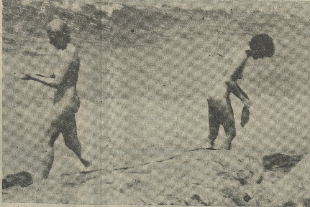
Διακόσιοι περίπου γυμνιστές δρικόονται αυτή τή στιγμή στα Μάταλα και ξεπλύνονται ή κυκλοφορούν κάτω άπ' τόν ήλιο του Λυδικού Πελάγου θεόγυμνο σαν τούς πρωτοπάλαστος μετά άπ' τή γεύση που καρπού του δέντρου τής γνώσης. Στη φωτογραφία μας δύο γυμνίστριες όπως τίς συνέλαβε ό φακός τού Νίκου Μαλτεζάκη.

*** ΑΝ ΤΟΥ ΠΑΡΕΔΟΘΗ όμως οικειοθελώς, τότε γιατί τόν κατήγγειλε στη Δικαιοσύνη θά πητε. 'Ομολογουμένως είναι περιεργό και ή άπάντησή δική σκολη. Προσωπικά δεν έγνωρίσα πεθερά, είχε πεθάνει όταν πήγε τήν κόρη τής — για να ξέσω από τήν ψυχολογία τών πεθερών. 'Ισως, άν είχα, να μπορούσα να δώσω κάποια εύλογηφή εξήγηση στην άποψία σας. Πάντως έκείνο που γνωρίζω είναι ότι ύπάρχουν πεθερές που βάζουν κάτω τίς κόρες τους στα ποσόντα. Και άστε έβίσατε τήν πεθερά τών νομίμων πώς ήταν ή γυναίκα του... Και όχι μία φορά, άλλα δύο! Τώρα βέβαια τό πώς