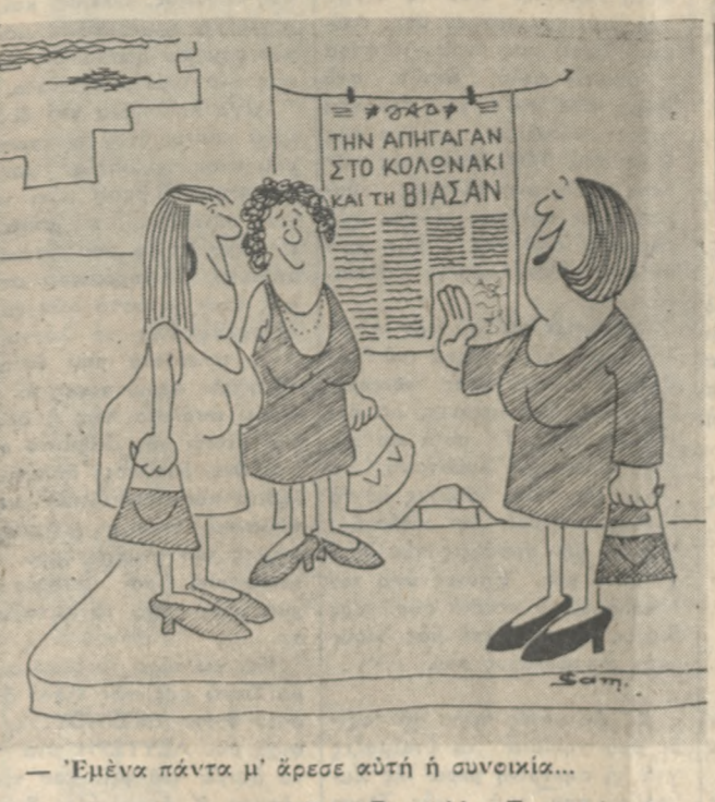
— Έμένα πάντα μ' ήρεσε αυτή η συνεικία... (Του Βαγγέλη Σαμαράκη)