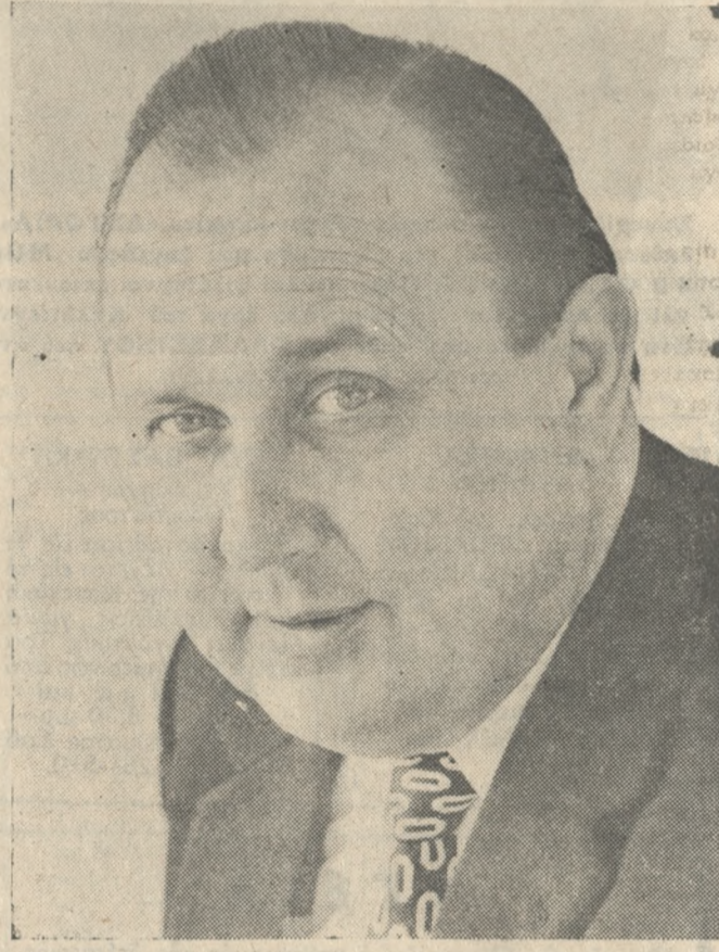
Ο υφυργός της Δυτ. Γερμανίας Άντιπρωκλέλληρος κ. ΓΚΕΝΣΕΡ

Επεί πλέον δεν θα πρέπει να μάς διαφύγει ότι τά έτη της έφηβικής ηλικίας, είναι ίσως τά προσδιοριστικά για την κατωπιή εξέλιξη της σκέψης του μαθητού. Στόν έφηδο ήδη έχουν δημιουργηθή ώριμομένα έρωτηματικά και προσπαθεί να άπαντήσει με τις δικές του δυνάμεις. Μάλιστα, πολλές φορές, έπιδιώκει και λύσεις και αυτό είναι έπικίνδυνο.