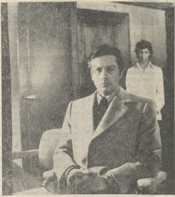
ΣΗΜΕΡΑ προβάλλεται στον Κινο «ΓΑΛΛΕΙΑΣ» η τελευταία ταινία του Άλαν Ντελόν «Ο ΚΥΚΛΟΣ ΤΟΥ ΜΠΟΥΜΕΡΑΚ»...