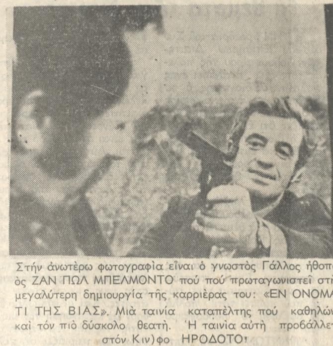
Στην ανώτερη φωτογραφία είναι ο γνωστός Γάλλος ηθοποιός ΖΑΝ ΠΟΛ ΜΠΕΛΜΟΝΤΟ...

ΝΕΟΣ άφιχθείς εκ Ν. Αμερικής με μεγάλη πτερου διοικήσεως εις οικοδομικές επιχειρήσεις κάτοχος πτερου χιόν, επίθυμει θέσιν υπεύθυνου. Τηλέφ. 011250807