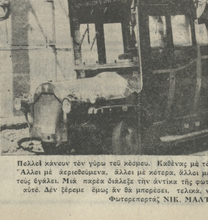
Πολλοί κάνουν τόν γύρω τού κόσμου με άντικα. Καθένας με τού μέσο της άρεσκείας του. Άλλοι με άεροπλάνο, άλλοι με κότερα, άλλοι με πεδήλατα, άλλοι... όπως τούς θάλασε. Μία παρέα διάλεξε την άντικα της φωταγερίας μας για τού σκοπό αυτό. Δέν ξερεμε όμως άν θα μπερδέσει, τελικά, να τόν πραγματοποιήσει.

Ο ΕΙΤΖΗ ΣΥΝΕΛΗΦΘΗ ΧΡΕΣ ΑΠΟ ΤΗΝ ΓΑΛΛΙΚΗ ΔΑΣΤΥΝΟΜΙΑ ΤΗΝ ΒΟΥΛΗΝ ΚΑΙ ΤΟ ΥΠΟΥΡΓΕΙΟ ΤΩΝ ΕΣΩΤΕΡΙΚΩΝ ΑΝΑΚΟΙΝΩΝ ΕΙΔΩΝ ΕΙΔΟΠΟΙΗΘΗ ΓΙΑ ΤΗΝ ΑΠΟΓΟΡΕΥΣΗ ΤΗΣ ΕΙΣΟΔΟΥ ΤΟΥ ΚΑΙ ΤΗΣ ΔΙΑΜΟΝΗΣ ΤΟΥ ΣΤΗΝ ΓΑΛΛΙΑ.